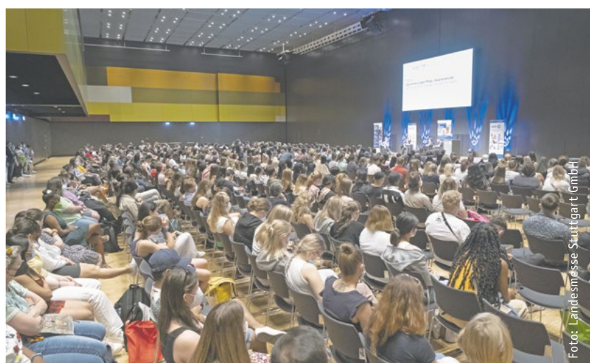
Großes Interesse fand der Kongress „Wie wird die Junge Pflege alt? – Nimm Deine Zukunft in die Hand!“

Weitere Informationen: www.messe-stuttgart.de