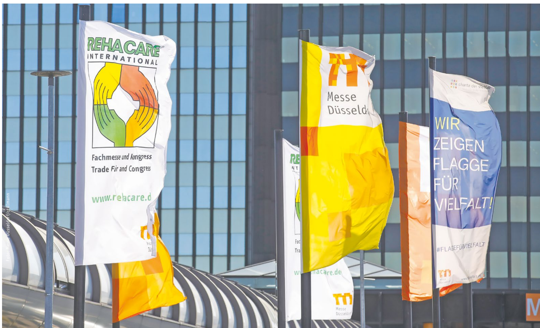
Alles unter einem Dach: Mobilitäts- und Alltagshilfen, Hilfsmittel für ambulante und stationäre Pflege, barrierefreies Bauen und Wohnen und vieles mehr.