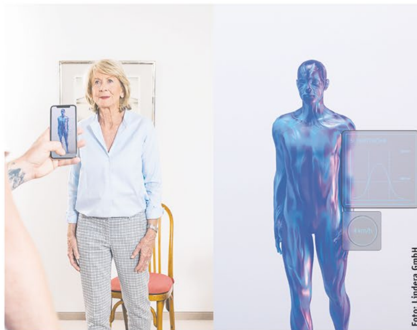
Die Lindera Mobilitätsanalyse: Effektive und KI-basierte Sturzprävention in jedem Lebensumfeld.

Genau an dieser Stelle kommen digitale Gesundheitslösungen wie die Lindera Mobilitätsanalyse ins Spiel. Mit der Lindera Mobilitäts-