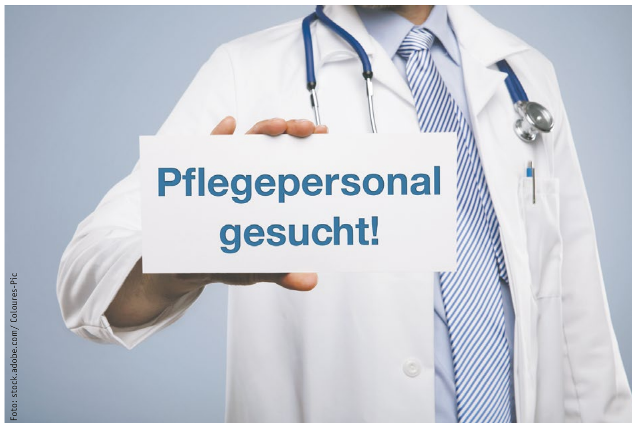
Motivation durch Stress-Reduzierung entspannt die Personal-Situation.

79 Tage haben sie in Nordrhein-Westfalen gestreikt. Natürlich ging es auch ums Geld. Aber nicht primär. Vorrangig ging es den Pflegebeschäftigten an den nordrhein-westfälischen Universitätskliniken um eine Verbesserung der Arbeitsbedingungen. Das haben sie mit der Einigung in der dritten Juliwoche erreicht. Denn jeder Arbeitgeber weiß: Verbessere die Arbeitsbedingungen, schaffe eine verlässliche Work-Life-Balance, das reduziert nicht nur den Stress und Krankenstände auf den Stationen, sondern erhöht auch die Motivation und Zufriedenheit der Arbeitnehmerinnen und Arbeitnehmer im Job. Das gilt für die Pflege in Kliniken wie für die Pflege in Pflegeeinrichtungen gleichermaßen. Vier Beispiele, wie man dazu beitragen kann: