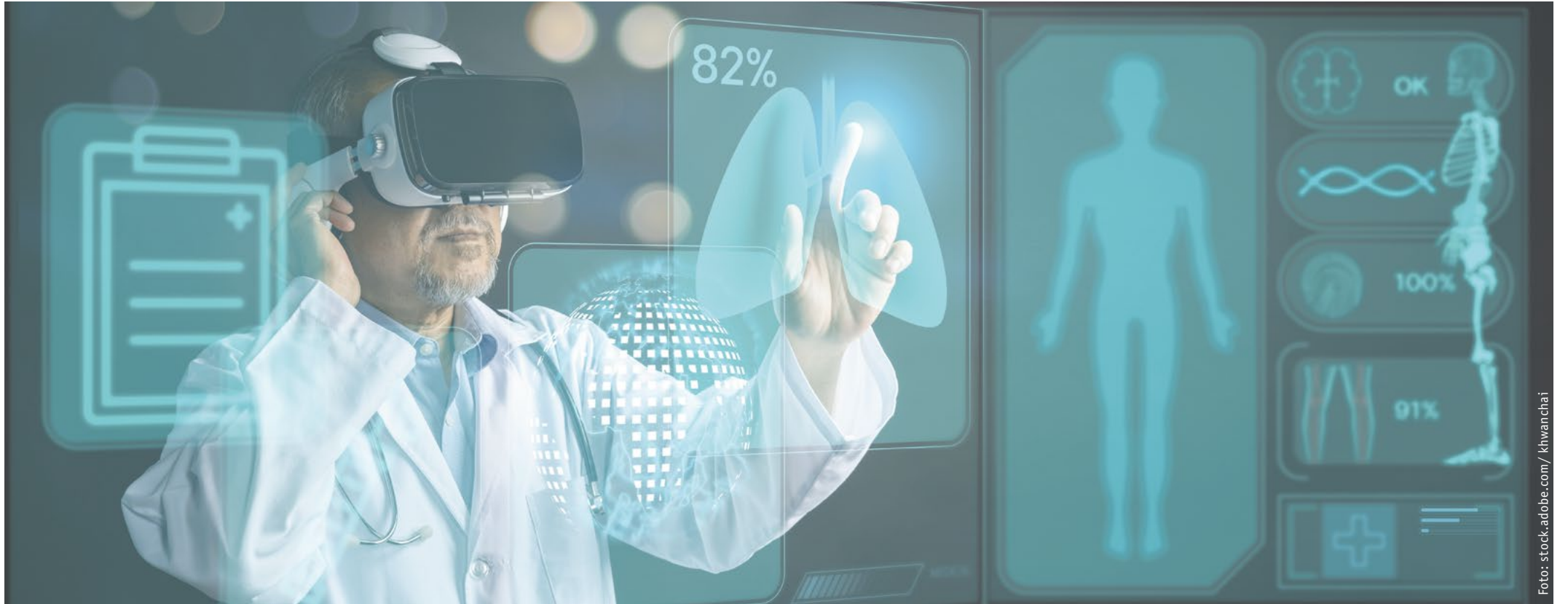
Die Softwarelösungen von MEDIFOX DAN sind nach Auffassung des neuen Inhabers von entscheidender Bedeutung für Gesundheitsdienstleister im außerklinischen Bereich.

Für rund 950 Millionen Euro – Managementstruktur, Standorte, Beschäftigte und Geschäftsprozesse sollen übernommen werden