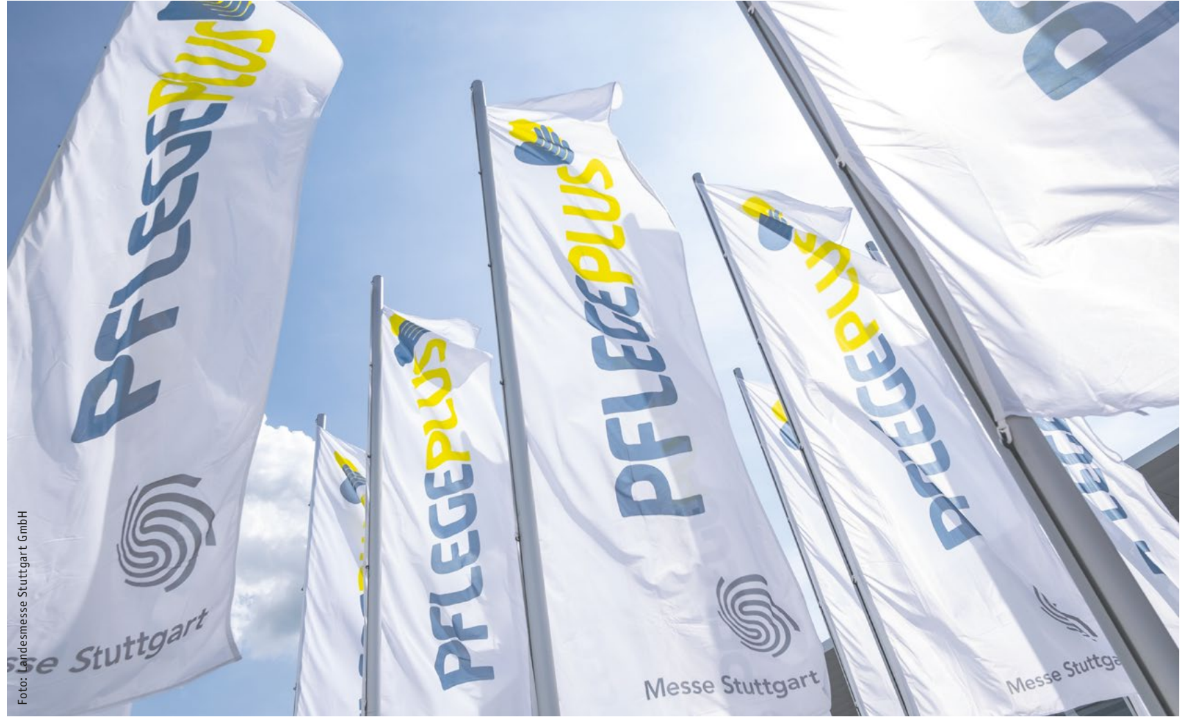
Eine Messe für Entscheider: Zwei Drittel der Befragten auf der PFLEGE PLUS sind an Einkaufs- und Beschaffungsentscheidungen beteiligt.

Eröffnet wurde die PFLEGE PLUS direkt mit den brennenden The-