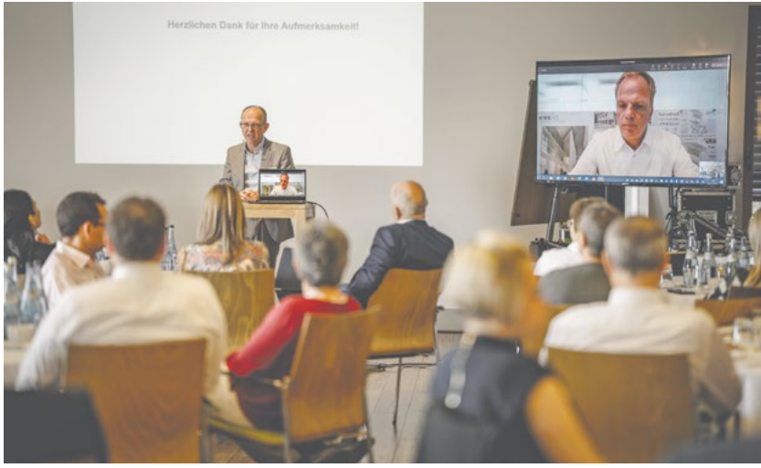
Workshops, Impulsvorträge und lebhaftige Diskussionen: Wenn wir nicht gut über die Pflege sprechen, wer tut es sonst?

lant oder stationär versorgt werden sollten. Das Modell liegt der Bundesregierung bereits in einer Petition vor und wartet auf Anerkennung als bundesweites Leistungsrecht.