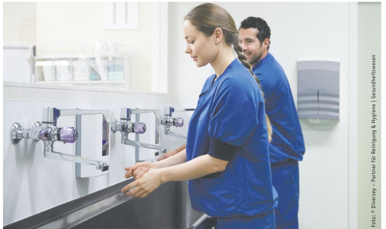
Die Norm geht auf dem heutigen Stand der Technik weiter in die Tiefe und definiert die Struktur-, Prozess- & Ergebnisqualität in den Einrichtungen.

Die DIN Norm liefert fakultativ einzusetzende, aber äußerst relevante Richtlinien und Anforderungen an die Reinigung und desinfizierende Reinigung in