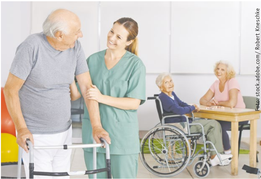
Eine offene Unternehmenskultur schafft zufriedene Mitarbeiter.

lassungen in ganz NRW arbeiten. „In jeder Filiale haben wir mehrere Ansprechpartner:innen, die sich um die Belange unserer Mitarbeitenden sorgen, ob es Probleme bei der Kinderbetreuung gibt, der zeitlichen Verfügbarkeit oder nach Weiterbildungsmöglichkeiten gesucht wird.“