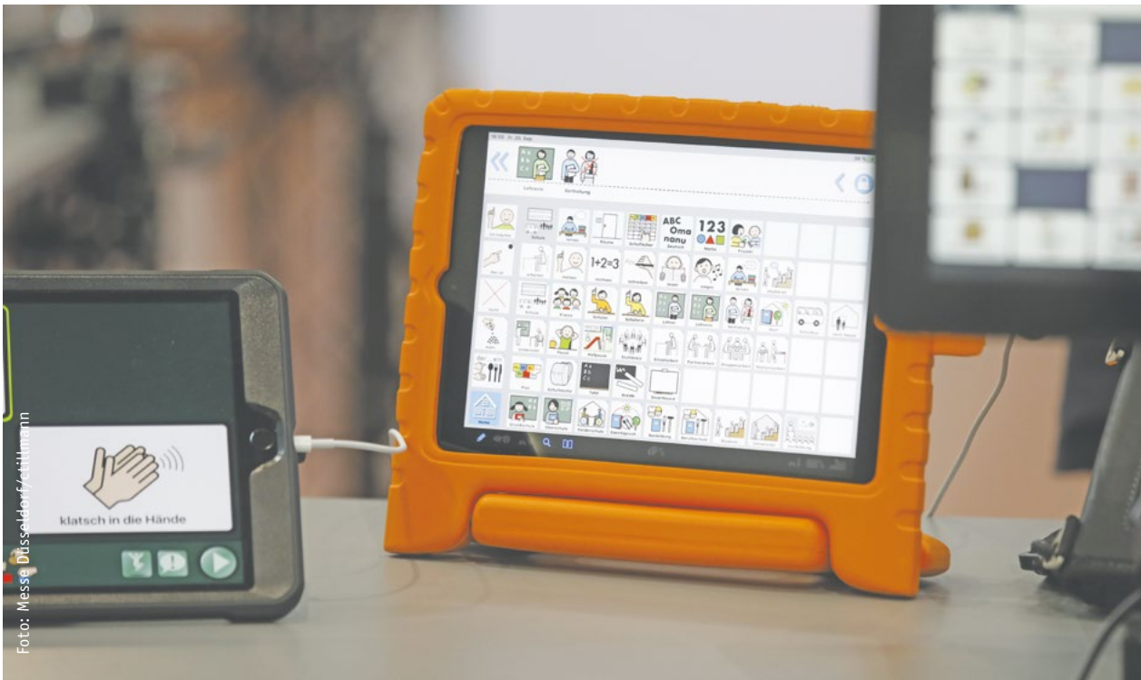
Neue Kommunikationstechniken spielen in der Pflege eine immer größere Rolle. Auch das spiegelt sich auf der Messe wider.

07. – 08. Dezember 2022 CONSOZIAL Nürnberg Fachmesse und Kongress der Sozialwirtschaft